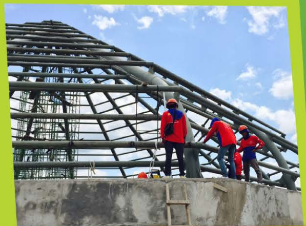
Proses Pemasangan Konstruksi