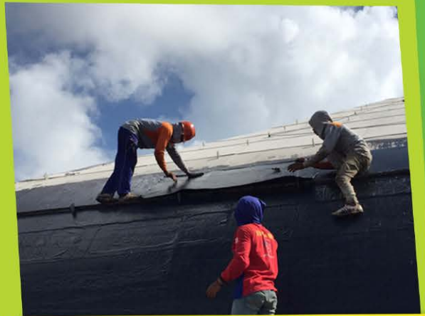
Proses Pemasangan Pelapis Anti Bocor