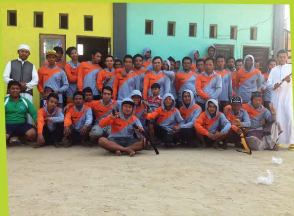
Team Duta Madinna Kubah